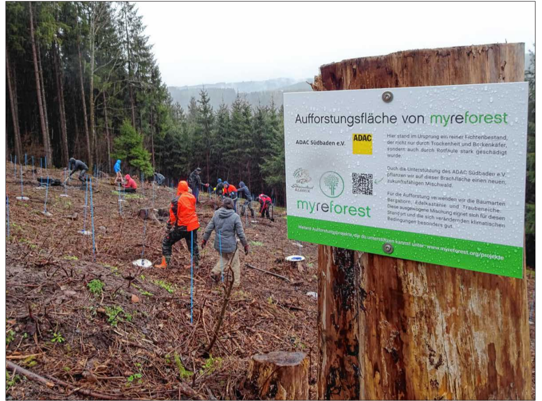
Trotz widriger Witterungsbedingungen haben der Club 82 und befreundete Helfer unter der Leitung der Organisation Myreforest rund 200 Bäume gepflanzt.

Die gemeinnützige Organisation ist in Kircharten ansässig und organisiert regionale Aufforstungsprojekte. Ziel ist es dabei, geschädigte Waldflächen und Monokulturen so umzubauen, dass daraus zukunftsfähige Mischwälder werden. Die Aufforstungsprojekte werden durch Spenden finanziert. „In diesem Fall konnten wir das Projekt dank der Unterstützung des ADAC Südbaden und der ADAC Schauinsland Klassik umsetzen“, berichtete Sandra Möbius, Projektleiterin der Myreforest gGmbH. Gepflanzt wurden vier unterschiedliche Baumarten: Esskastanie, Bergahorn